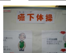
失語症、誤嚥などを防ぐ嚥下体操