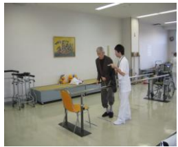
リハビリ専門職員による個別リハビリ