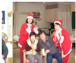
年末恒例 クリスマス会