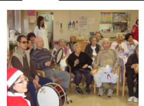
楽器を使っ ての音楽の時間